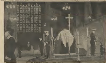
SIR WINSTON AWOR TA DESCANSA DEN GOLANAHAN NA UNDA EL A NAGE — Retornu mortal di Sir Winston Churchill manera cu e tabata poni den vestibulo di Westminster. E prome guardia di honor a wordo forma diaman mañta dor di cuater oficialnan di marina Botanico y dos polis femenino. Durante tres dia largo e inglesnan por e rendi e ultimo homenaje na e gran homber di estado aki, pasando den fña grandi nos di e restonan mortal. Tabata un entierro sin igual, cual a wordo atendi pa Reina Isabel II y representantenan di 112 nacion.

Un die poco hobenan tin bano cu ta den directiva di Lago, kende dia 1 di e luna aki a word promové como personal relation and compensation adviser.